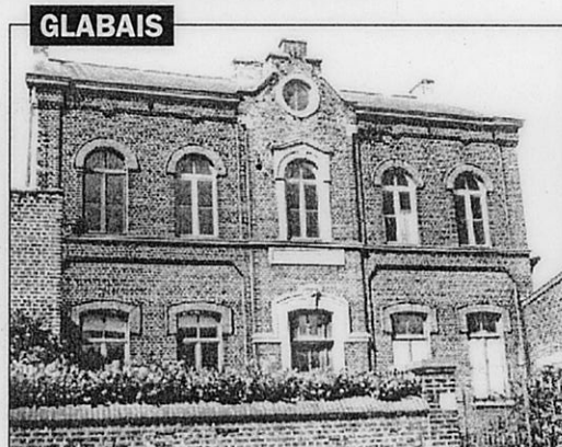
chef. La décision d'une nouvelle affectation n'a pas encore été prise, et beaucoup de Glabaisiens verraient y avec faveur