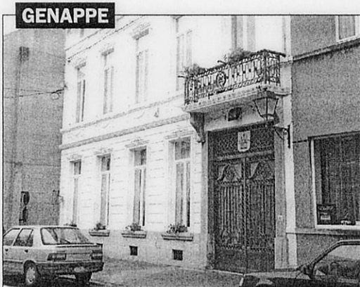
À Genappe, la maison communale abritera l'hôtel de police après la construction du nouvel immeuble prévue sur le site de l'Espace 2000.