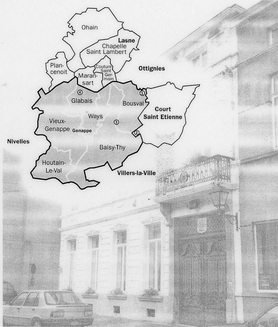
(1) Le « riche » domaine de la Motte demande en vain son rattachement à Court-Saint-Étienne. (2) Le hameau de Tangissart est cédé à Court-Saint-Étienne. (3) Baisy-Thy et Bousval voulaient fusionner sous le nom de Baival. (4) Glabais, Plancenoit, Maransart et Couture-Saint-Germain espéraient être réunis dans l'entité d'Aywières-L'Abbaye.

Dans cinq des huit communes concernées par le projet ministériel, les débats se dérou-