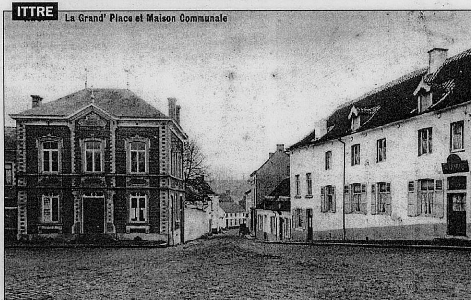
Souvenirs, souvenirs. Ci-dessus, une vue de la maison communale d'Ittre et de la Grand-Place en 1910. Méconnaissables. Le bâtiment abrite aujourd'hui la salle du conseil communal et la salle des mariages. Le syndicat d'initiative de la ville y a également trouvé place, à quelques mètres de ce qui fut, naguère, le centre géographique de la Belgique. 010983