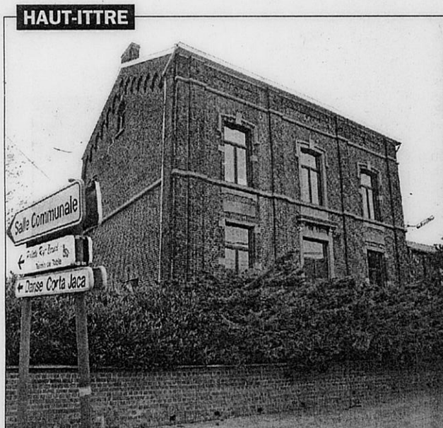
Dès la fusion, la maison communale d'Haut-Ittre a été remise en état pour devenir ce qu'elle est encore aujourd'hui, c'est-à-dire une salle communale et de réunion pour les associations de l'entité. Le CCL (comité culturel et de loisirs) en est l'un des utilisateurs. BW 010978