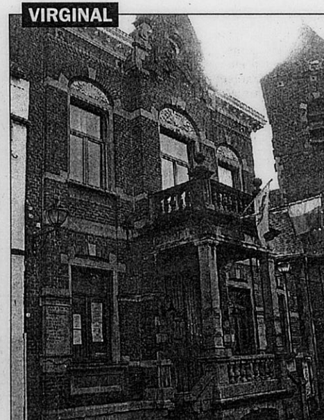
Dès la fusion des trois entités, la maison communale de Virginal a abrité des permanences. Depuis 1987, une bibliothèque a également fait son apparition. L'ALE a pris ses quartiers à l'étage, comme la salle des commissions. BW 010974