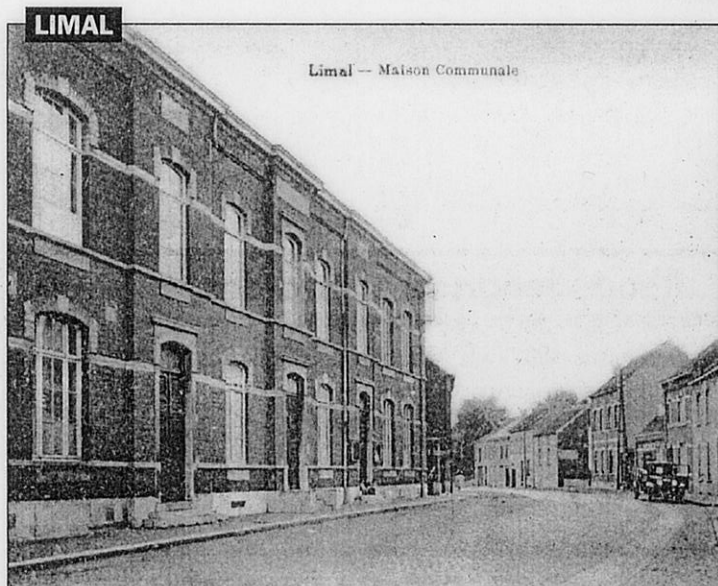
Limal — Maison Communale