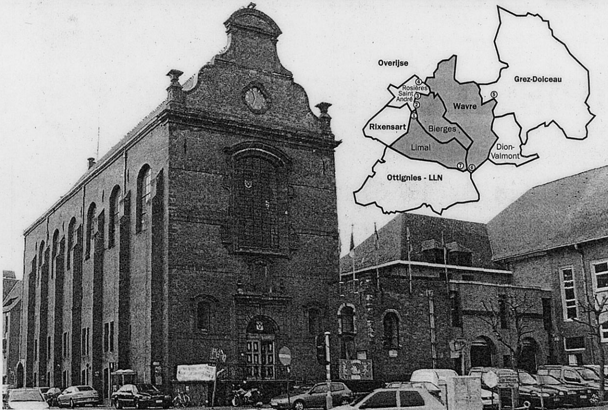
Rixensart revendique Villagexpo (1), le bois de Mérode (2) et Angoussart (3). Wavre riposte en exigeant le sud de la Lasne sur Rosières (4). Wavre souhaite également le sud de Gastuche (5) et Dion-Valmont. Des terrains de Wavre (6) et de Limal (7), situés sur le domaine de l'UCL, sont cédés à Ottignies-LLN.

Malgré leurs 13 000 habitants et une majorité absolue, la « fusion de velours » s'est révélée être un vrai piège à rats pour les socialistes de la cité du Maca.